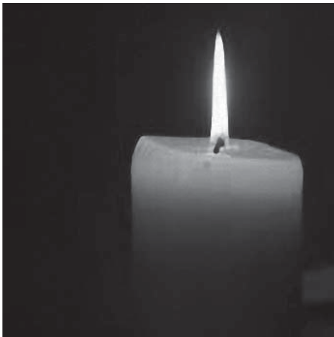
Svijeća - simbol naše molitve

Pod izrazom „svi sveti“ ne misli se samo na osobe koje su službeno proglašene svetima, već na sve one koji su za života živjele u skladu s Božjom voljom. Upravo takve Crkva želi počastiti