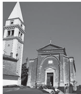
Crkva Sv. Martina u Vrsaru

11. studenoga: Sv. Martin – Beram, Dolenja Vas, Ližnjan, Sv. Martin (Martinski), Momjan, Sv. Lovreč Pazenatički, Tar, Vrsar .