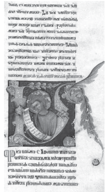
Misal kneza Novaka

Krajem 19. i početkom 20. st. staroslavenskoj je liturgiji i hrvatskom jeziku u Istri objavljen rat do istrjebljenja. Tako je porečki i pulski biskup Ivan Flapp, Furlan po rodu, godine