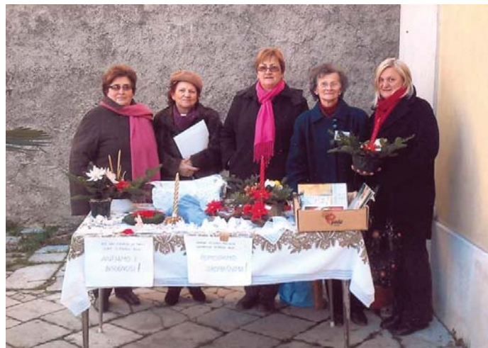
Članice udruge sv. Vinka Paulskog