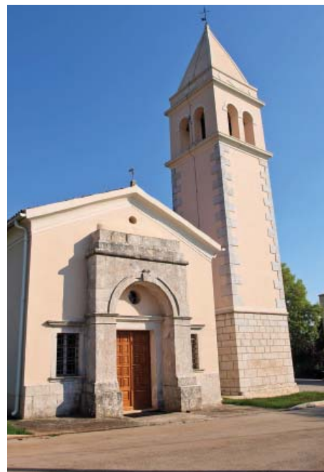
Crkva u Baderni