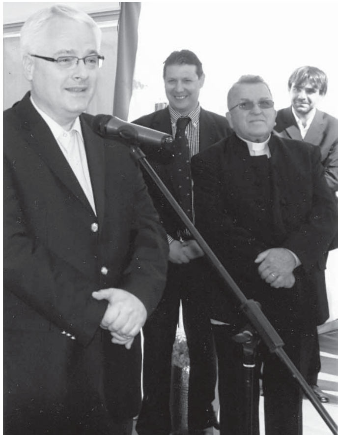
Predsjednik Josipović u Livadama

NESVAKIDAŠNJI SLUČAJ. U Puli se 28. listopada zbio nemili događaj: čovjek je ujutro, nešto prije 6 sati na nogostupu na pulskoj Rivi pronašao promrzla četverogodišnjeg dječaka. Hitno je prevezen u bolnicu s više prijeloma. Pretpostavlja se da ga je otac (majka ne živi s njima) ostavio samog, dječak se