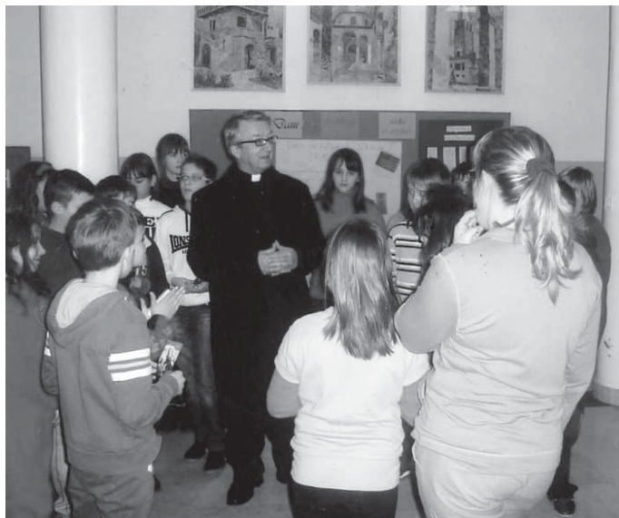
Druženje s biskupom

Naše se društvo dobrano oprostilo od biblijske slike čovjeka. Nažalost, iz čovjekove je svijesti iščeznula misao da su muškarac i žena Božje stvorenje, da nas je Bog