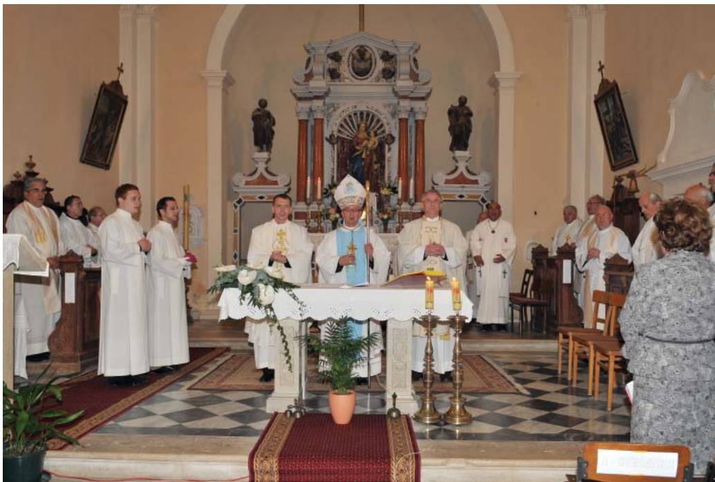
Sv. misa u Kringi

” Nakon mise u crkvi je prikazan dokumentarni film „Mons. Božo Milanović – tragovi jedne vizije“, novinarka HRT-a Irene Hrvatin.