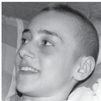
Chiara Luce Badano

CHIARA LUCE BADANO PROGLAŠENA BLAŽENOM. U rimskom svetištu Gospe od Božanske ljubavi prefekt Kongregacije za kauze svetaca, Angelo Amato, beatificirao je 25. rujna pripadnicu nove generacije pokreta fokolara, Chiaru Luce Bodano (1971. – 1990.). U sedamnaestoj godini oboljela je od tumora kostiju, od kojega je i umrla. Njena poruka mladima bila je: "Imate samo jedan život i vrijedi truda dobro ga utrošiti".