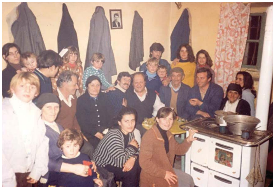
Svećenik Istranin u albanskoj obitelji

Gledajući jedne večeri 1991. godine na televiziji program pod naslovom «Albanski egzodus» i vidjevši pun i nabijen brod mladeži i dotad pristiglih oko 5.000 ljudi u Bari (Italija), sažalio sam se nad njima i bio vidno potresen. Promatrajući te ljude u bijedi osjetio sam jak poriv i poziv: „Idi tamo (u Albaniju) pomoći i kao svećenik naviještaj i propovijedaj Radosnu vijest“. Bio je to osjećaj neizrecive radosti. Tom se pozivu nisam mogao suprotstaviti i bio sam ispunjen nečim posebnim. Kako? Ni danas ne znam odgovor. Pomislio sam na trenutak je li sa mnom sve u redu. Obavijestio sam i biskupa Antuna Bogetića o tom svom stanju i želji da odem u Albaniju.