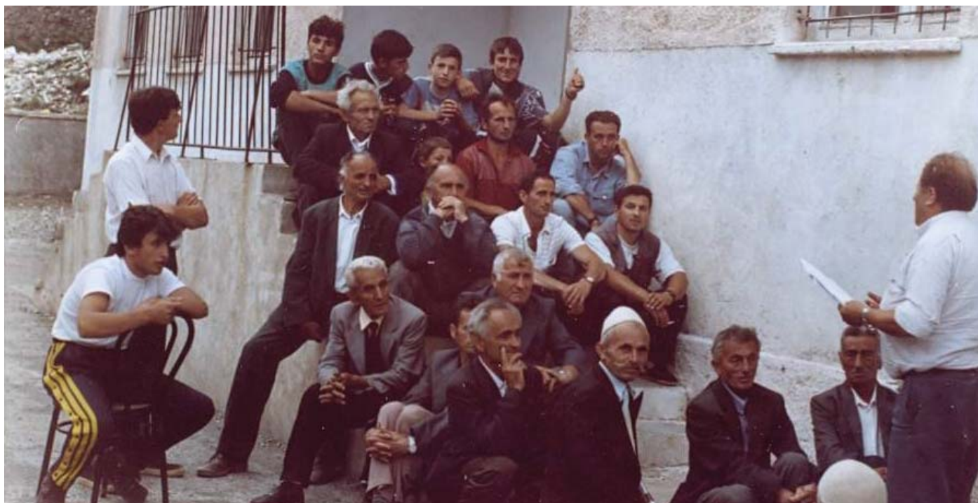
Misionar u Albaniji

što ste svojim dolaskom izrazili spremnost i odanost služenja Crkvi i u ovoj zemlji, ali ja Vam savjetujem radi situacije ovdje da se vratite doma. Kad se stvari srede, kontaktirat ćemo Vas i dogovoriti ponovni dolazak. Ovdje trenutno nema nikakve crkvene odredbe, nema župe, nema biskupije i ne može se odrediti kamo da Vas pošaljemo. Stanje je teško i dok ne nađemo kakvo-takvo mjesto za smještaj i djelovanje nemoguće je ovdje raditi“. Odgovorio sam mu: „Za moj smještaj ne trebate se brinuti, a za evanđeosko djelovanje sve je spremno. Stanje je takvo kakvo je, a ima ljudi posvuda koji žele čuti riječ Božju kao što mlade ptice u gnijezdu čekaju da im majka donese hranu“. Na to mi odgovori: „Bog te blagoslovio i svaka ti čast!“