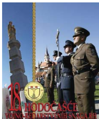
Hodočašće pripadnika hrvatskih oružanih snaga i hrvatskih branitelja

PROSLAVLJENA 400. OBLJETNICA DOLASKA KAPUCINA. U Hrvatskom