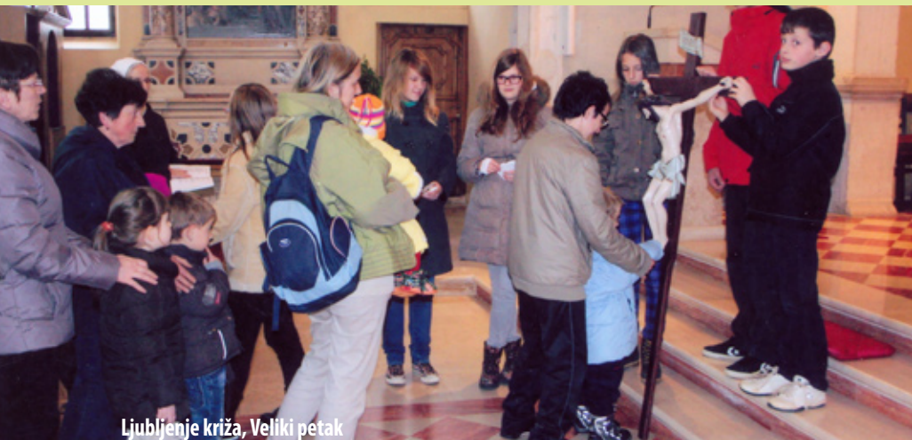
Ljubljenje križa, Veliki petak