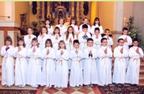
Sv. Mihovil, Prva sv. Pričest, 16.5.2010.