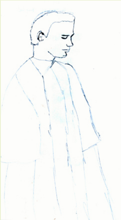
Antica Vadanjel, 5a OŠ V. Nazora Pazin