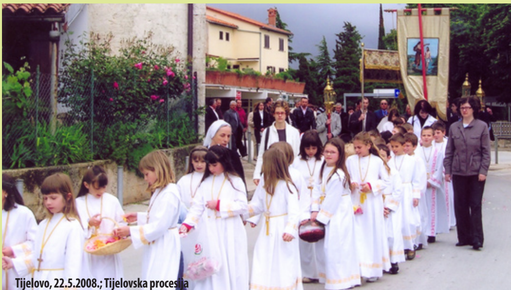
Tijelovo, 22. 5. 2008.; Tijelovska procesija