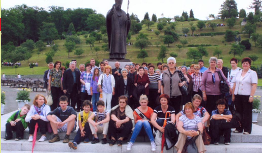
Marija Bistrica, 9. 6. 2012., hodočašće župljana Žminja